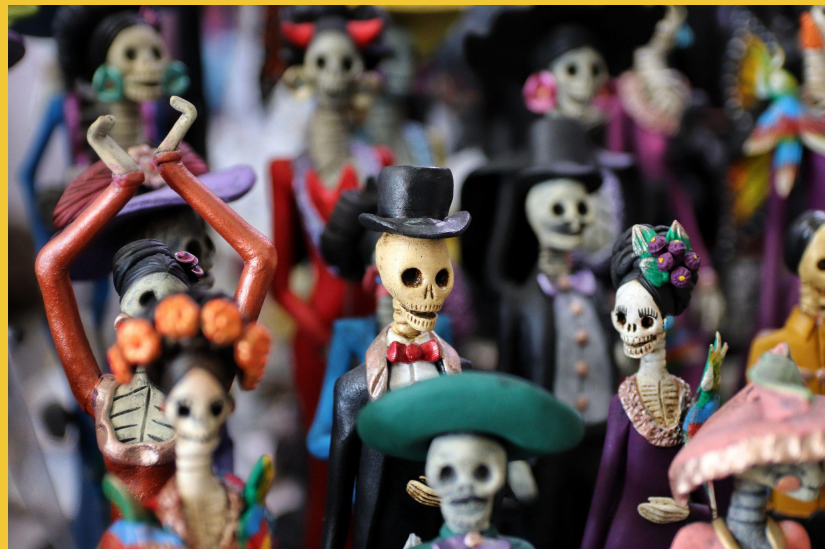
Mendez, Mario. "The Bachelor." Unsplash , 10 Aug. 2020, https://unsplash.com/photos/c64AB11j-po . Accessed 5 May 2022.