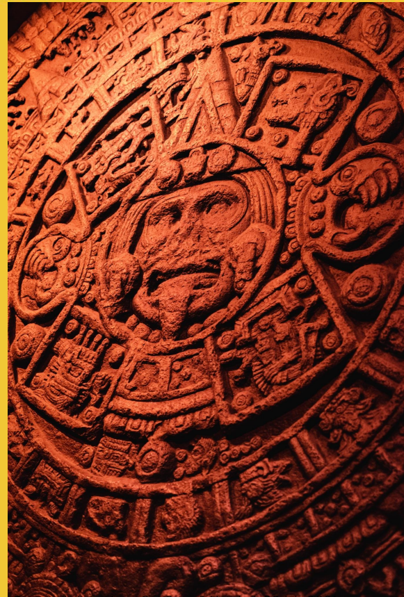
Domenech, Luis. "Aztec Sun Stone." Unsplash , 20 July 2021, https://unsplash.com/photos/eXw5w-4eflU . Accessed 5 May 2022.