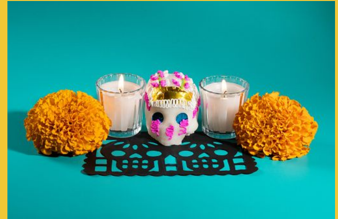
MarsBars. "Day of the dead pottery skull (calavera) votive candles and marigold cempasuchil flowers on black papel picado on teal blue background, Dia de Muertos concept stock photo." 2021. iStock, https://www.istockphoto.com/photo/day-of-the-dead-pottery-skull-votive-candles-and-marigold-cempasuchil-flowers-on-gm . Accessed 5 May 2022.

Explorar la importancia de la muerte en México en los ensayos de Octavio Paz, con un enfoque en analizar de manera crítica los argumentos del autor en torno a la influencia de la historia del país en las celebraciones del Día de los Muertos.