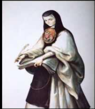
Narración: Diana Candy